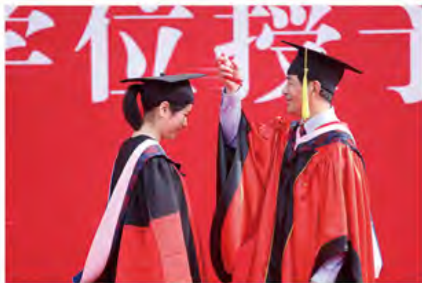
王广谦校长为2017届博士研究生拨穗、颁发毕业证书和学位证书