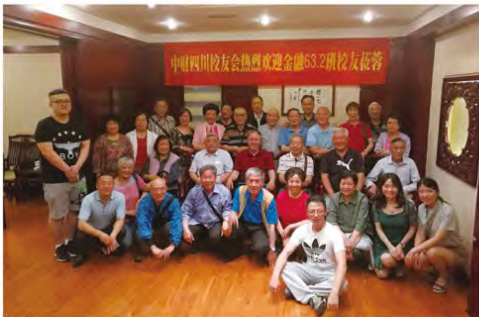
四川校友会与金融 632 班校友在成都龙抄手旗舰店共叙校友情

2017年5月10日-17日，我校金融632班近40位校友齐聚成都，共庆毕业五十周年，四川校友会热烈欢迎老校友来川，重温母校情长，共话似水年华。