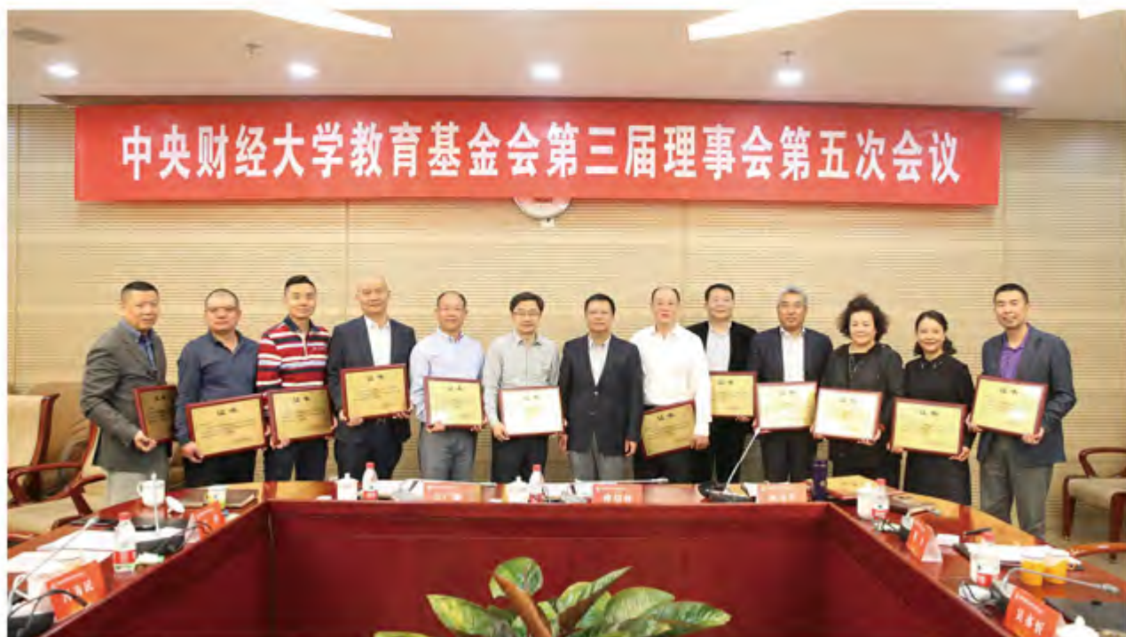
柯理事长为各位理事授牌

法规的研究和学习，吃透上级文件精神，并积极主动地与上级部门进行沟通和反馈，确保基金会各项运作管理的合法合规性。第三，进一步增强筹资能力。基金会要开展专题研究，调研和学习国外一流大学基金会的筹资和管理运作模式，汲取成熟经验，探讨实现路径，拓宽筹资渠道，提升筹资能力。第四，科学合理的配置各项资源。基金会要在确保合法合规的基础上，摸清基金会资金使用的特点和需求，做好资产配置，优化投资组合，