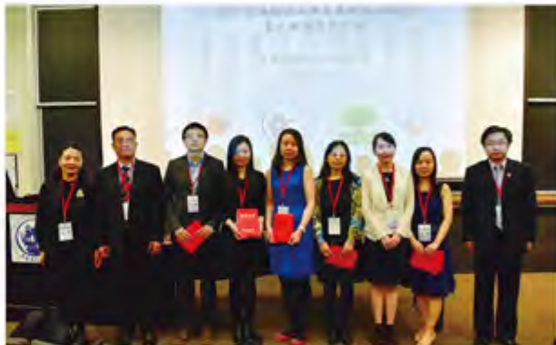
北美校友会 2017 年校友工作先进个人合影