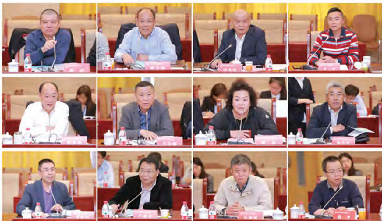
基金会各位理事、监事发言

告、2017年工作要点、2017年预算报告、2015年年检整改情况、基金会申请2017年度参加民政部社会组织评估、基金会制度建设情况、第一届投资咨询委员会工作报告、投资咨询委员会换届建议方案等九项议案逐一进行了认真审议。经过充分酝酿讨论，理事会全体参会人员分别对各项议案进行审议并投票表决，会议全票通过了各项议案。