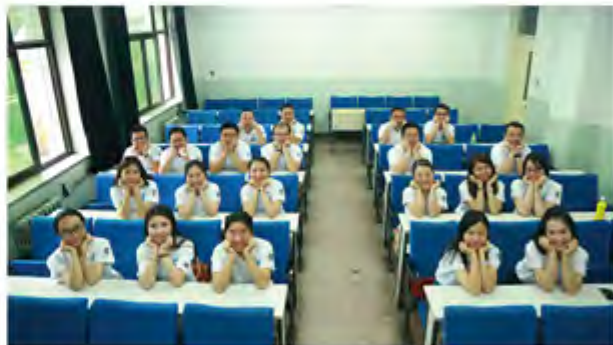
学院南路活动剪影