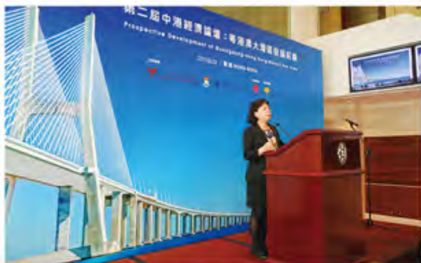
香港大学副校长区芳杰致辞