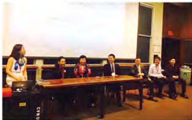
圆桌论坛：就业选择与职业规划