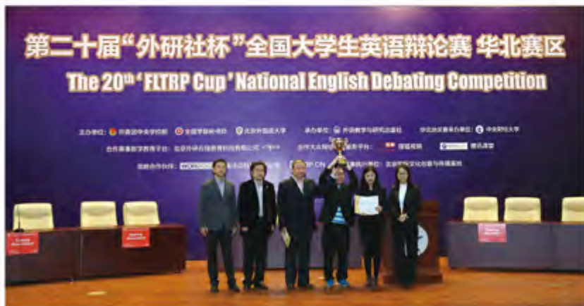
我校代表队荣获冠军