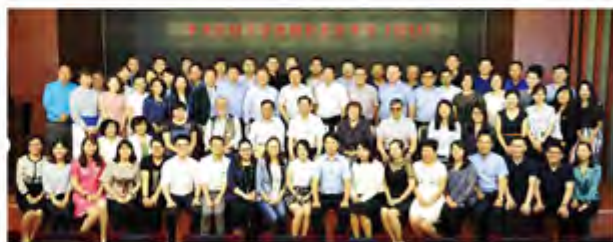
校领导与校友合影