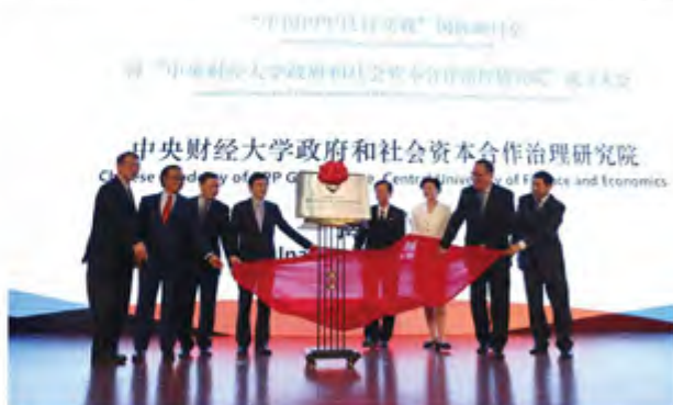
为中央财经大学PPP治理研究院的成立揭牌

中国自2014年开始推动PPP改革，经过三年多实践，PPP政策框架已形成，项目实施见成效，初步实现了公共服务供给创新，为深化体制改革和推动国家治理现代化注