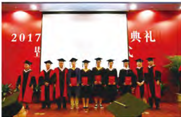
信息院校友大使受聘仪式