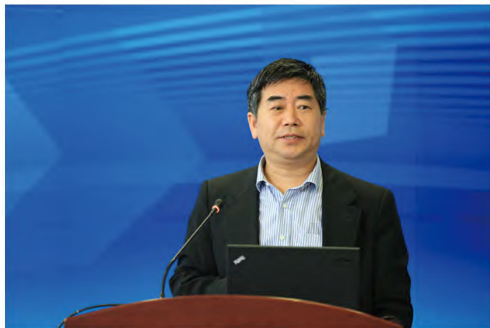
焦瑾璞局长做主旨发言

中国人民银行金融消费者权益保护局局长焦瑾璞做了主题为“我国普惠金融发展进程研究”的主旨演讲。焦局长以普惠金融的发展历程为主线，阐释了普惠金融的度量和标准、普惠金融账户的国际比较。在账户方面，中国超过国际平均水平，开立账户数量与教育和收入呈正相关。而在账户使用率上，中国个人银行账户使用率较低，参与商业活动量少，但汇兑业务较活跃。随着移动支付的推行，移动银行在低收入人群中扩大金融包容性发挥了重要作用，因此焦局长提出偏远地区开展移动支付的发展建议。他还提出了应科学地界定普惠金