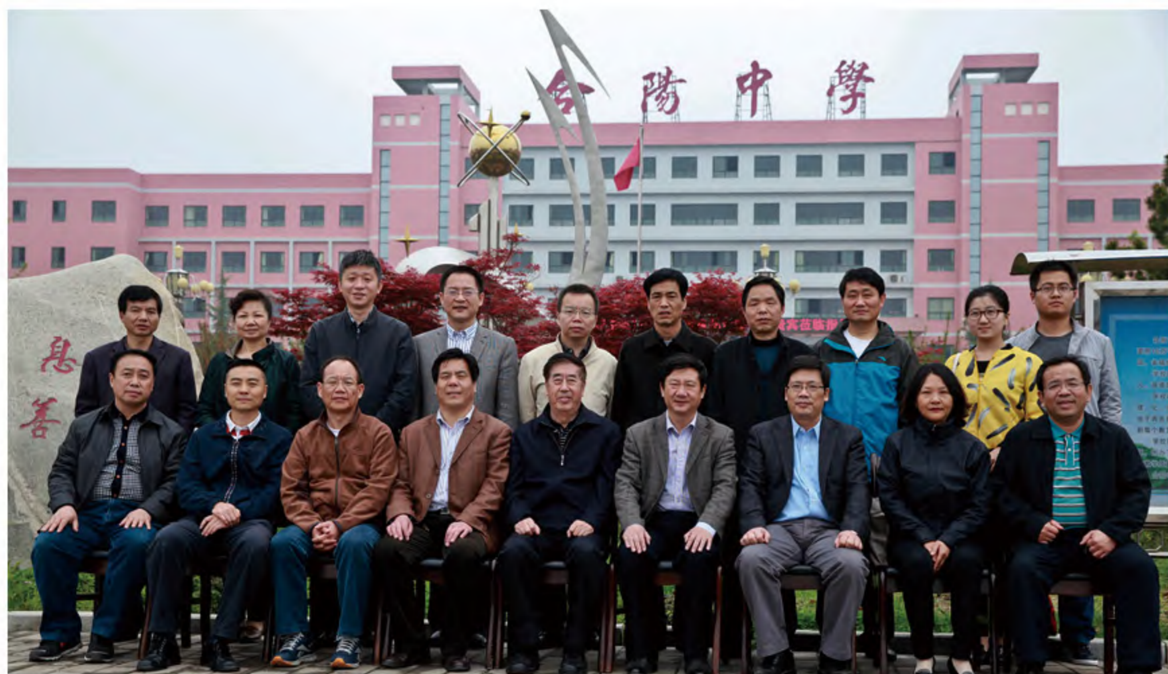
参加调研合阳中学全体人员合影