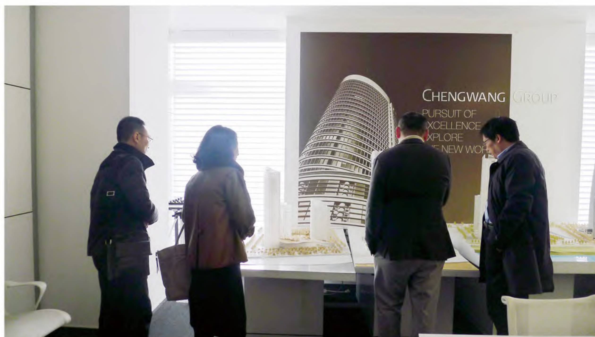
参观骋望集团开发项目