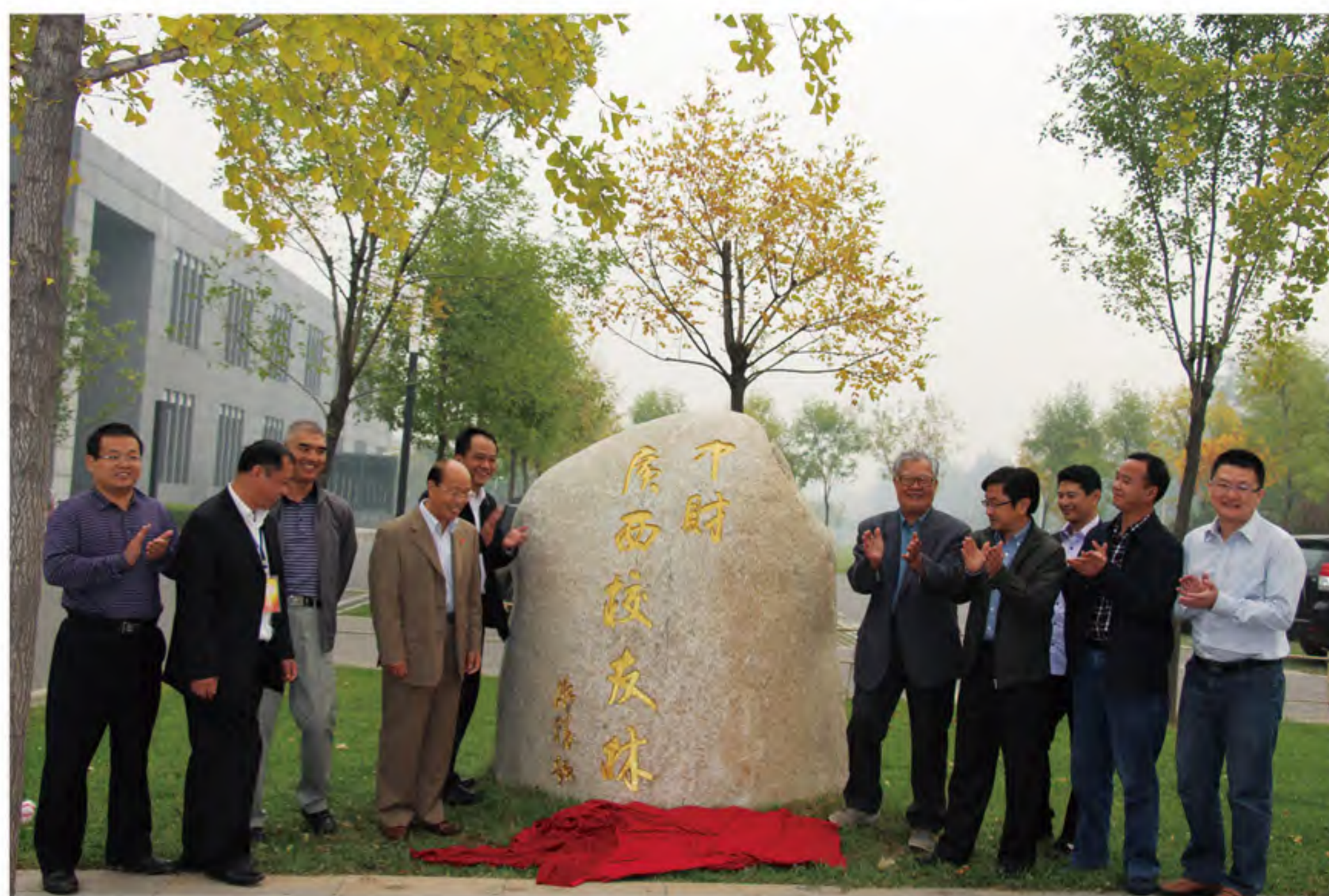
“广西校友林”揭牌仪式