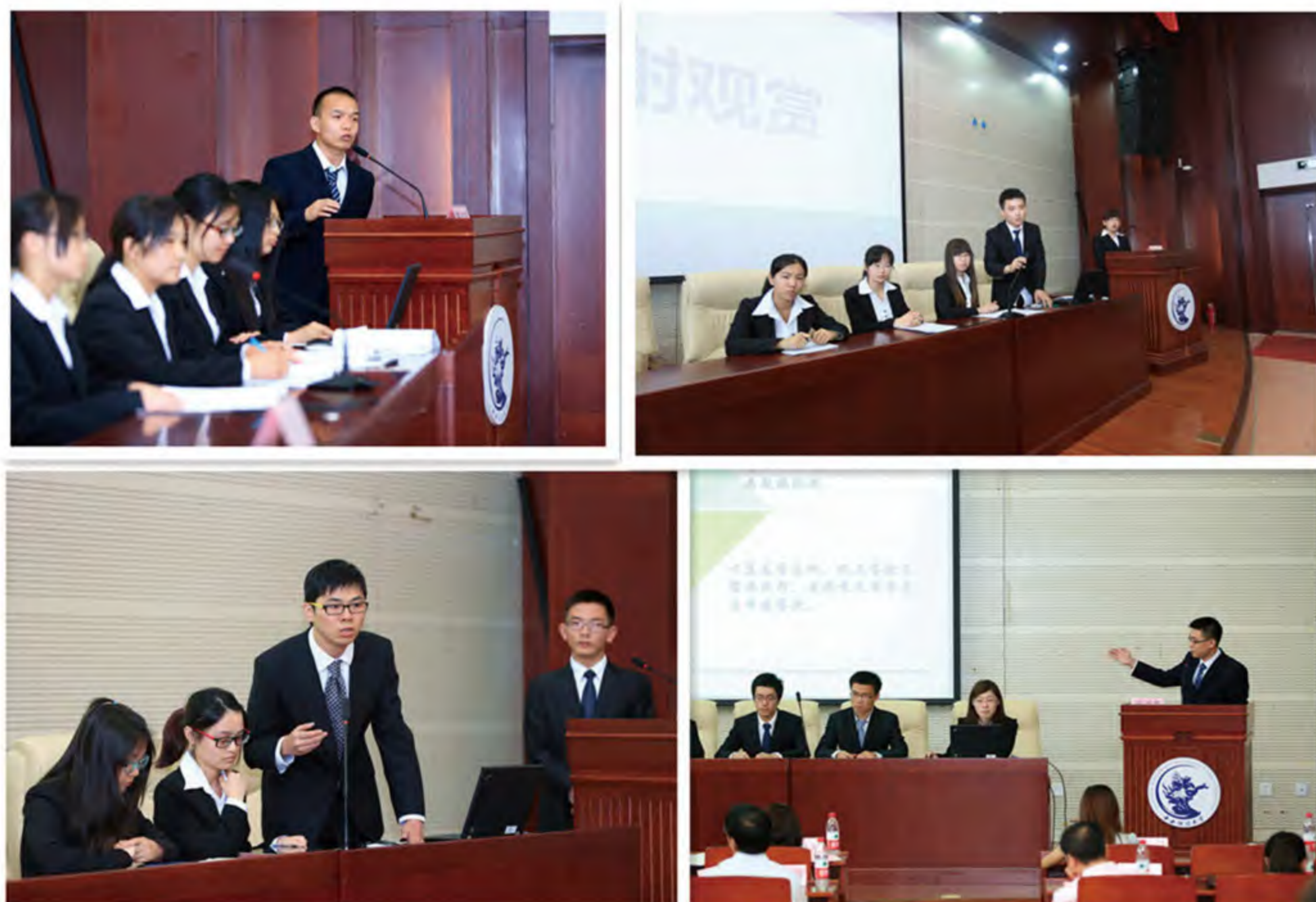
各团队做精彩陈述和答辩

评委们对各团队的表现给予了肯定评价，有针对性地对报告内容和答辩情况提出相应问题，并参照决赛评分标准，从团队配合及教师指导、研究思路与结构、研究方法、资料准