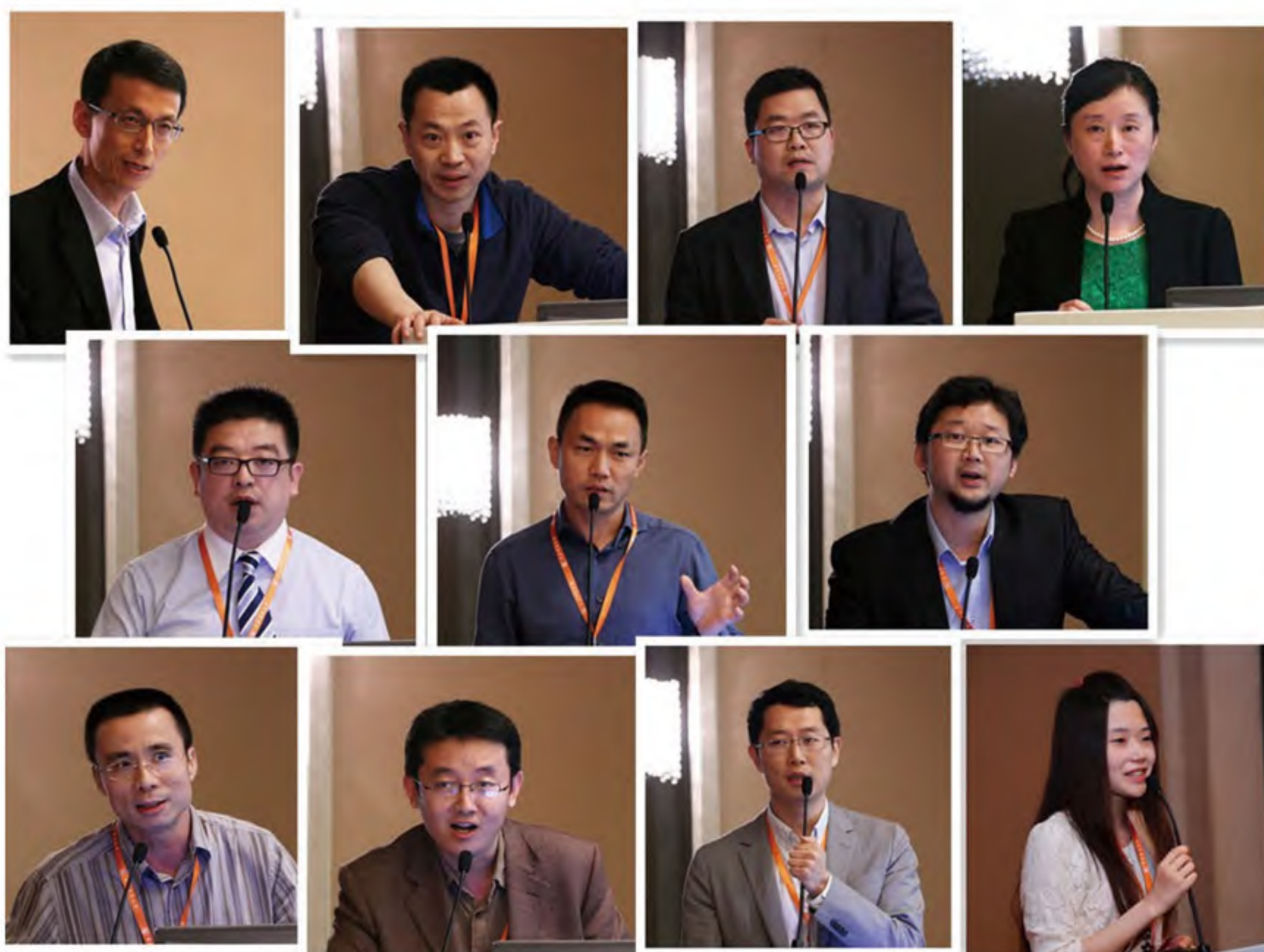
校友畅谈互联网金融