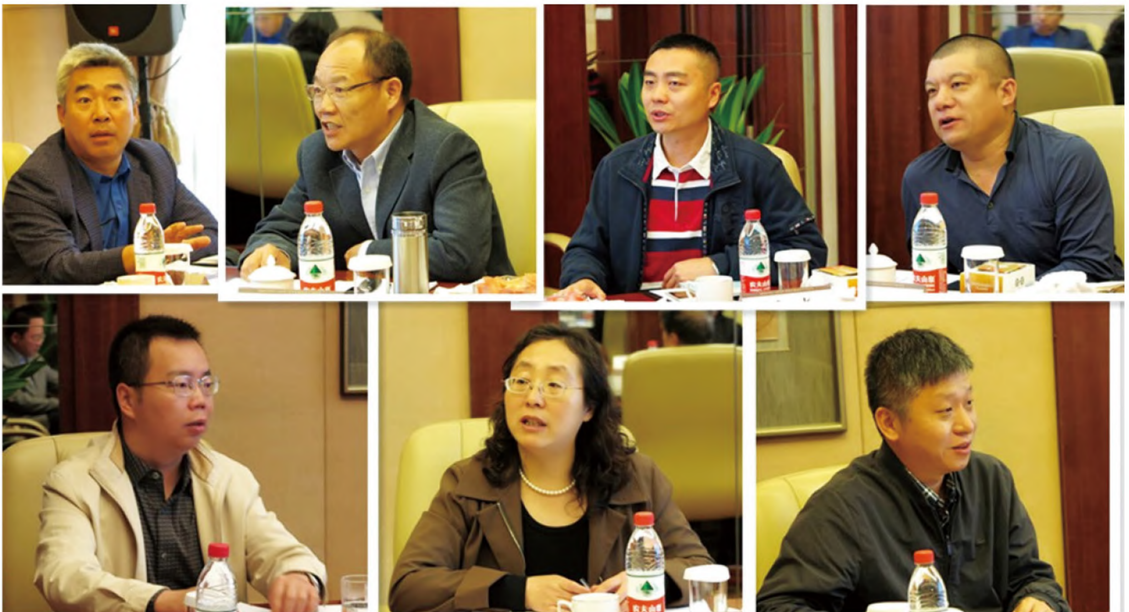
理事、监事建言献策

在会议讨论阶段，各位理事、监事为基金会发展积极建言献策，并针对基金会目前发展中遇到的问题，从筹资方式、资本运作模式、对外宣传方式、奖励基金设置、国家政策利用方式等诸多方面提出了中肯的意见和建议。