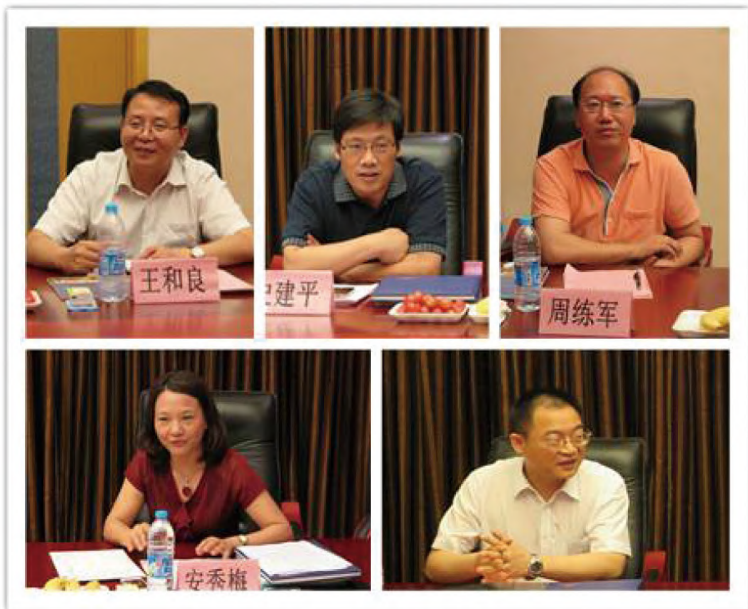
热烈友好的合作洽谈

员工近2千人，总资产达121亿元，2013年销售收入234亿元，居于中国企业500强之列，已经成为湖南省第二大民营企业。大汉集团多年来在县级城镇积极采取“修好一条