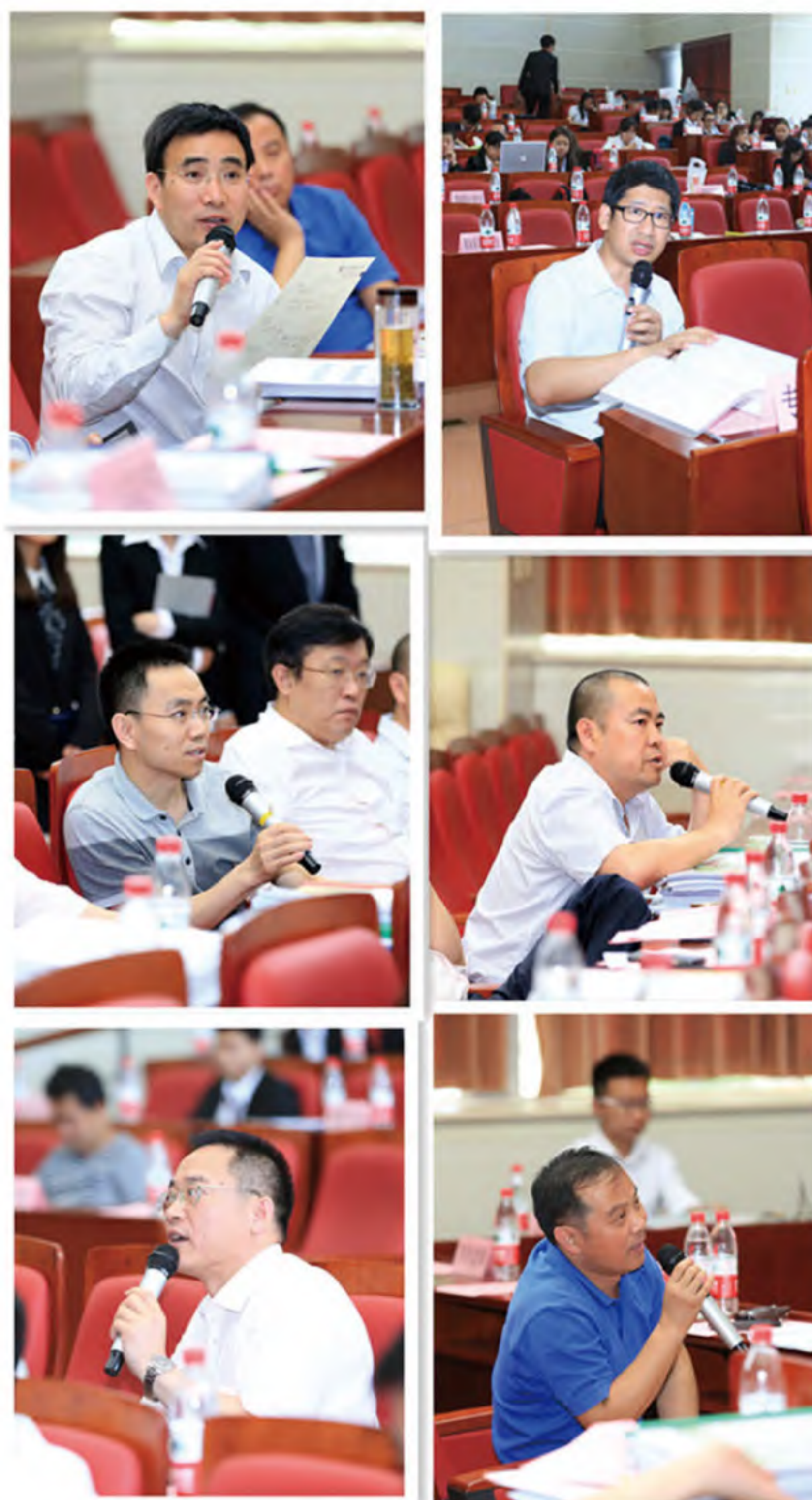
评委麻辣提问及精彩点评