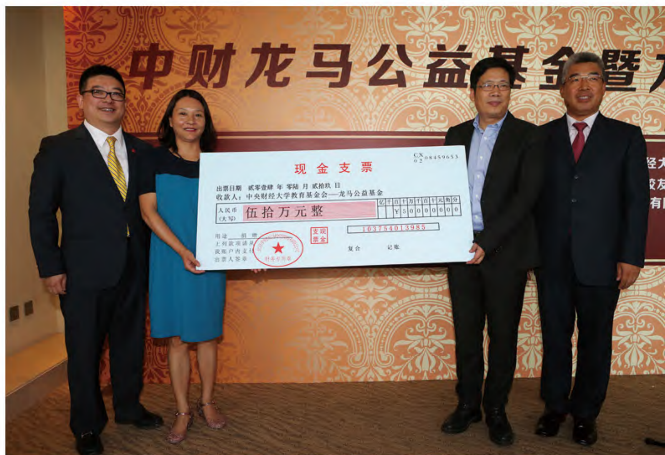
中财龙马公益基金捐赠仪式