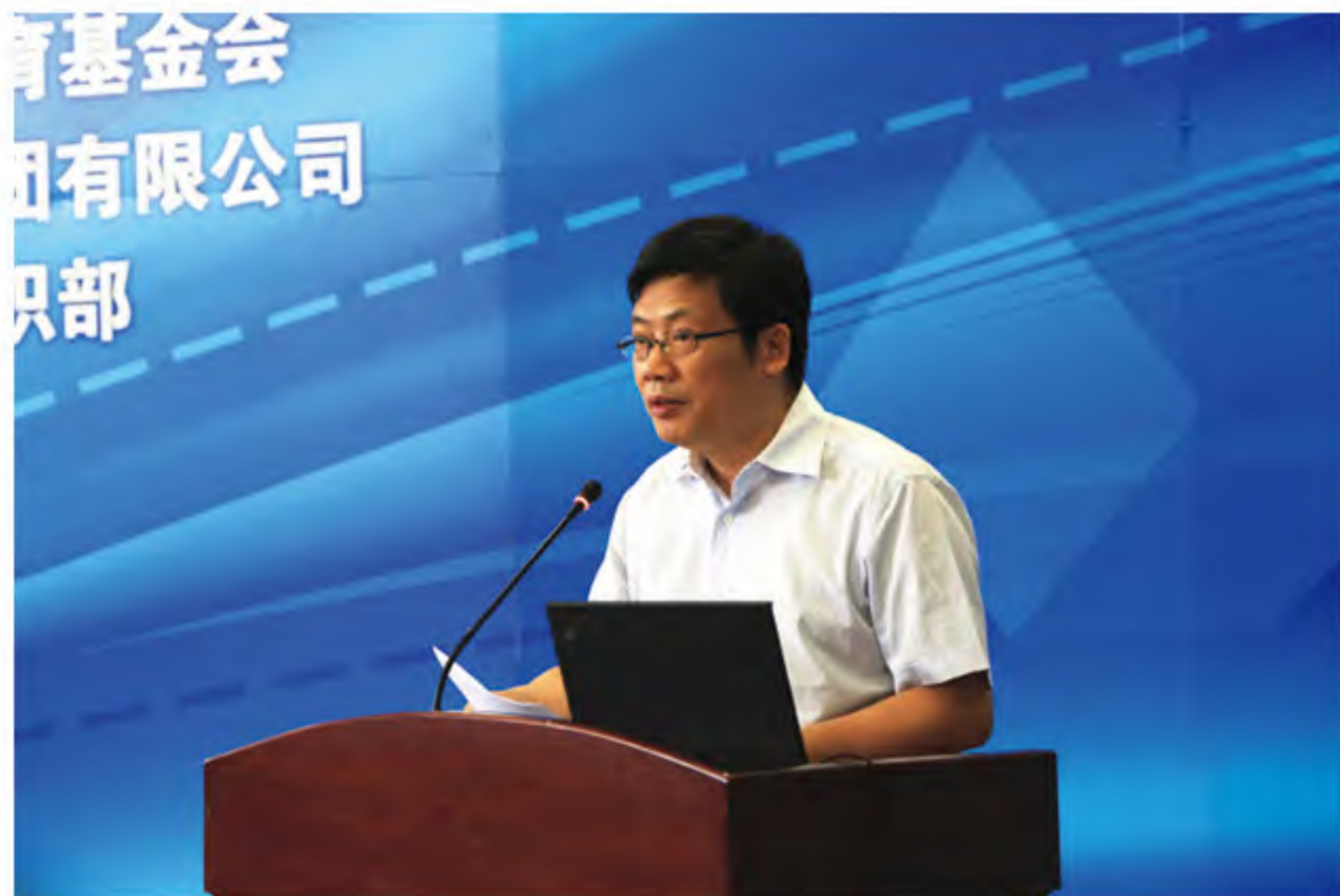
史副校长致开幕辞

史副校长首先对出席本次论坛的各位嘉宾、老师及同学们表示热烈欢迎。他说，自2010年以来，我校和鸿基世业集团已经联合举办了四届中央财经大学——鸿基世业财经论坛，在校内外引起巨大反响，取得了良好的社会效益，论坛已逐步成长为我国宏观经济与行业研究的高层次论坛。本届论坛以“中国普惠金融的发展与创新”为主题，旨在深入探讨我国普惠金融所面临的各种新机遇和挑