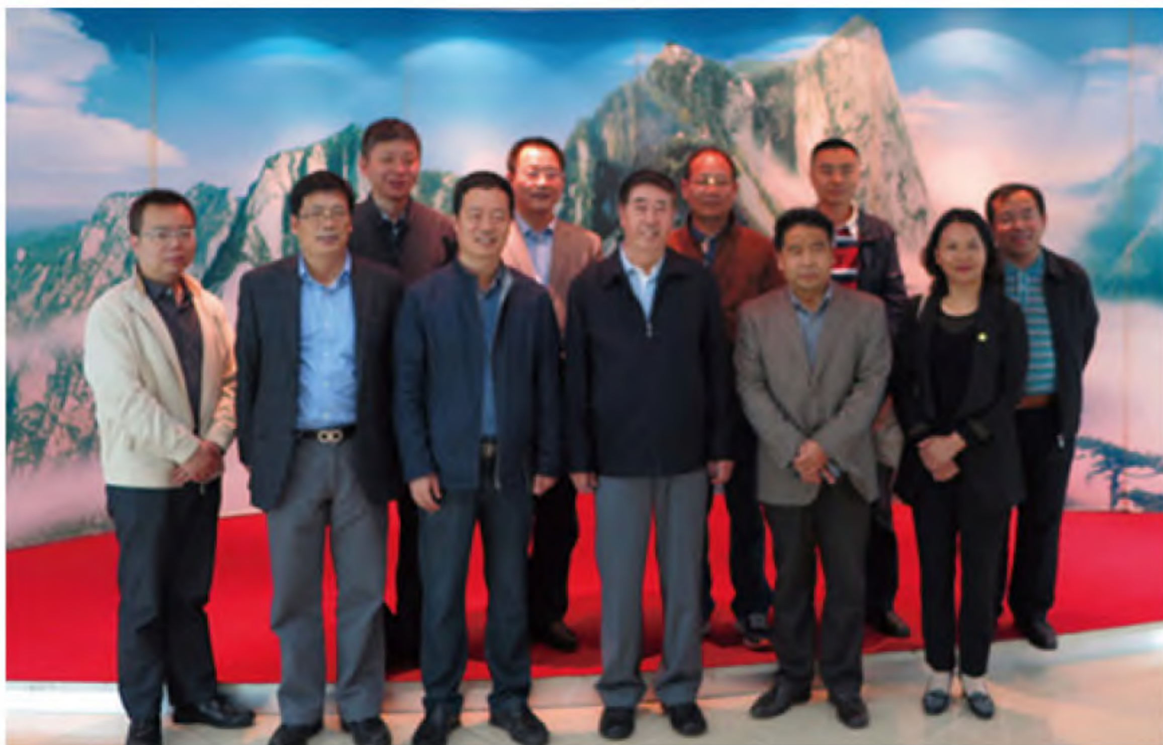
全体理事、监事在渭南考察合影

革，不断满足新形势下干部教育的需要，升级财大培训基地这一平台，为渭南市培养更多适应新时期建设需要的懂经营、会管理的新型经济管理领导干部。