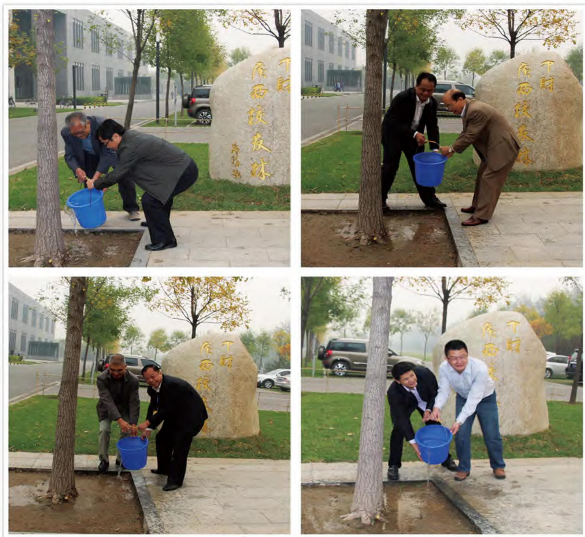
浓浓母校情，共浇校友林

2014年，正值母校建校65周年华诞，校基金会开展了地方校友林捐赠活动，为各地校友表达对母校的感恩与祝福之情提供了平台。活动通知一经发布，广西校友会随即撰写了《关于为母校65周年校庆捐款的倡议书》和捐赠管理办法，通过校友微信群、qq群等多种方式发布给广西校友，号召大家行动起来，为母校的繁荣发展贡献自己的一份力量。倡议得到了广西校友的积极响应，几天内，满载着广西校友爱心、感恩与祝福之情的30万元校友林捐款到达母校，在沙河校区主教楼南侧认养了一片校友林，为母校送上了一份满载爱心的绿色寿礼。