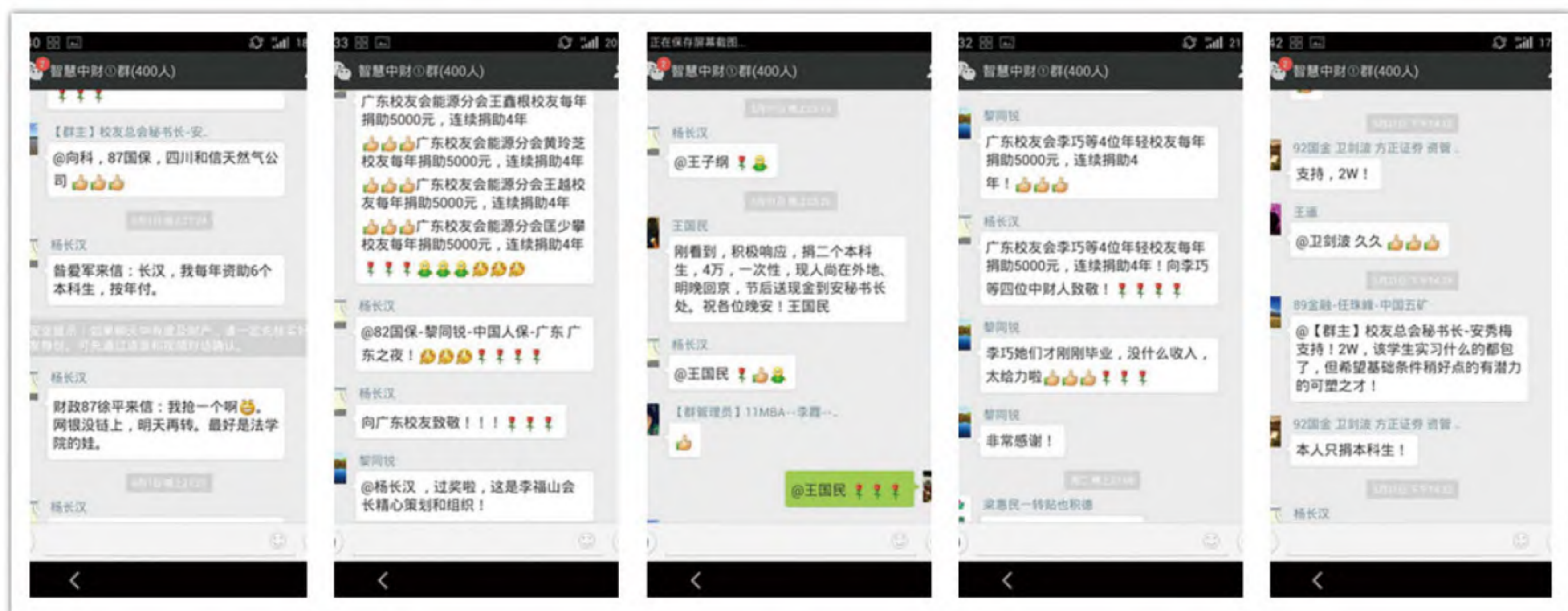
校友们积极献爱心