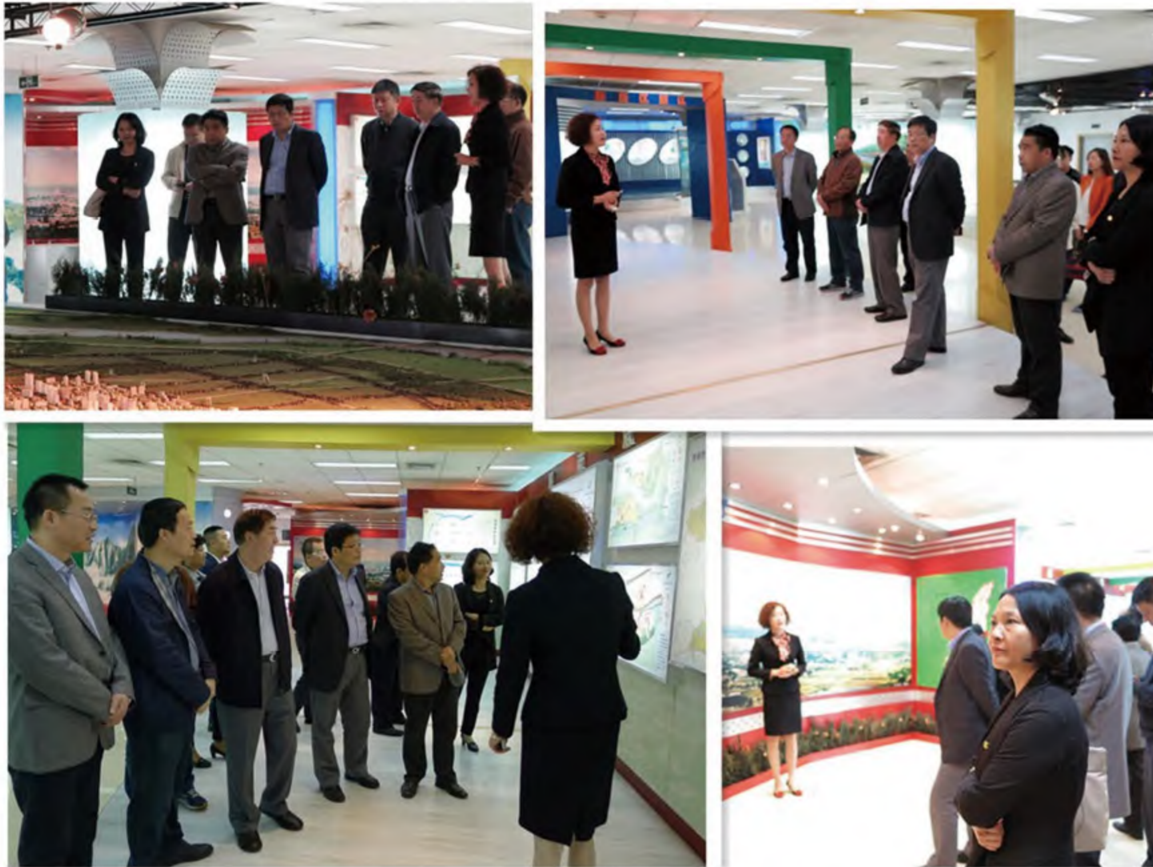
理事会成员参观渭南市城市规划展示馆

自2011年“渭南市人民政府—中央财经大学—鸿基世业集团”三方建立战略合作关系以来，由教育基金会主导的陕西省渭南市干部培训项目得到了有关各方的大力支持和积极配合，培训工作开展顺利。为考察渭南干部培训项目的实施成效，深入了解当地经济发展实际需求，更好地展开产学研合作，2014年4月19日下午，在基金会第二届理事会第三次会议结束之际，理事会全体成员到渭南市进行实地考察。