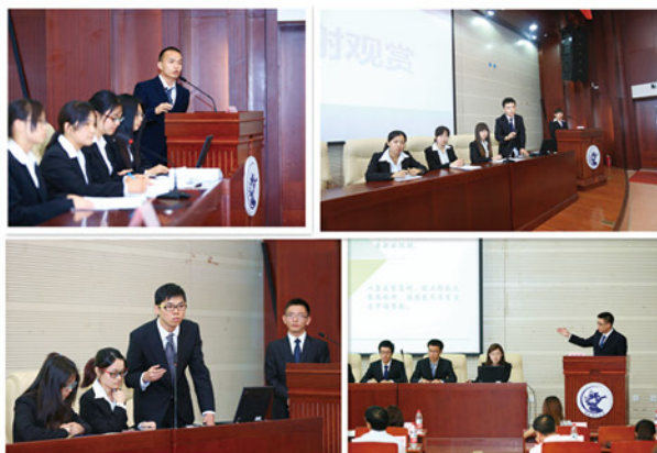
各团队做精彩陈述和答辩

评委们对各团队的表现给予了肯定评价，有针对性地报告内容和答辩情况提出相应问题，并参照决赛评分标准，从团队配合及教师指导、研究思路与结构、研究方法、资料准备、行文规范、案例分析、结论的创新性和实践意义、现场演讲及答辩表现等几方面综合评定，最终评选出“掘金者”团队为本次大赛的冠军团队，并评出亚军团队2支、季军团队3支、优秀奖团队5支、提名奖团队10支。在大家的紧张等待和期盼中，鸿基世业投资集团副