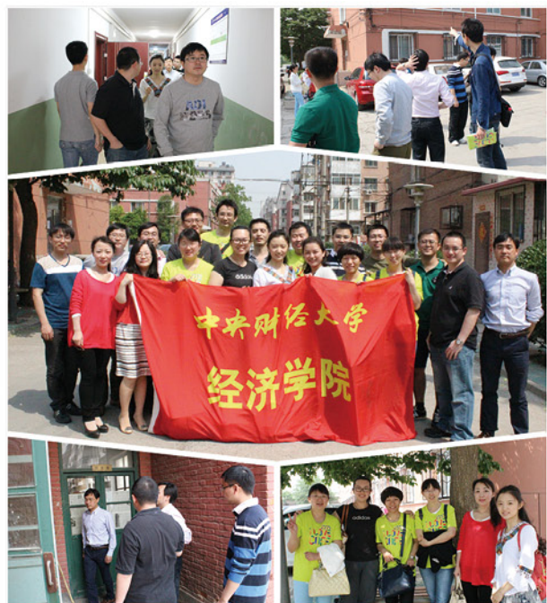
经济学院校友回访清河校区

2014年5月16-17日，经济学院举行2000级本科校友毕业十周年返校纪念活动。经济学院2000级经济学班23位本科校友从海内外各地重返母校，欢聚一堂，共叙昔日情怀。