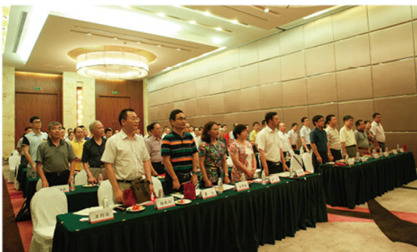
全体奏唱《中财之歌》