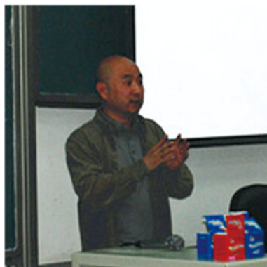
鲁冀校友做主题演讲