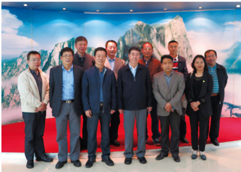
全体理事、监事在渭南考察合影

至此，中央财经大学教育基金会赴渭南及合阳中学的考察圆满结束。（教育基金会秘书处供稿，责任编辑：魏巍）