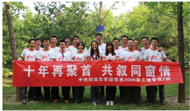
校友林认养挂牌仪式

衷的骄傲和感叹。全班还前往沙河校区举办了树木认养挂牌仪式，在班长组织下，同学们将写有“情系母校、友谊长存”以及46名同学名字的纪念牌亲手挂在集体认养的银杏树上，既表达了工程2班全体同学对母校的怀念与感恩之心，也象征着同学们的深厚情谊。（2000级工程管理2班供稿，责任编辑：宁小花）