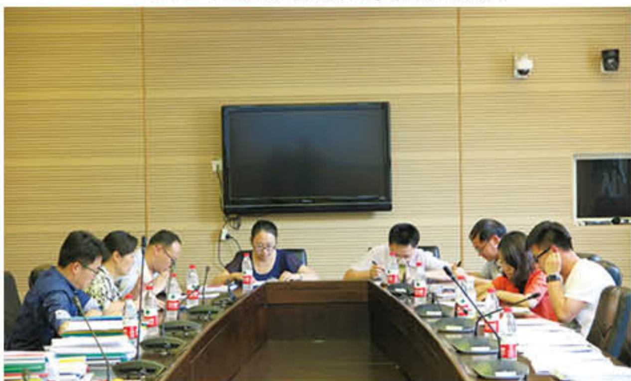
2016年“学生综合奖”评审会议现场

生及教师关注度较高的“中财蹦豆”微信公众账号上进行推送，对于今年申报有所变化的建成助学金、红风助学金、手牵手助学金的具有受资助资格的同学发送点对点短信通知，尽可能让每个在校师生都收到奖励基金申报和评审的通知。基金会发布的《关于开展2016年中央财经大学奖励基金评审工作的通知》仅在学校官网的累计点击量近4万次，受到师生的热切关注。