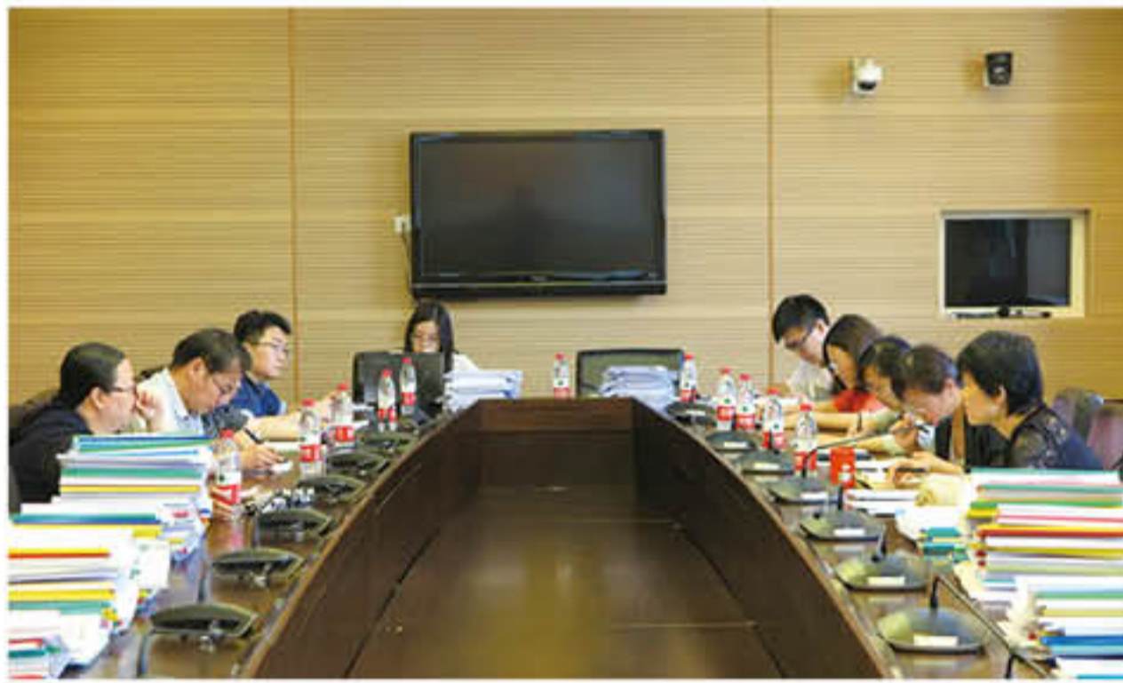
2016 年“助学奖学金”评审会议现场

风助学金、手牵手助学金，由于今年仅需满足相应条件就可以获得联系资助，因此今年该三个奖项也在奖助基金线上进行申报，同其他奖项一起完成线上审核和线下评审。