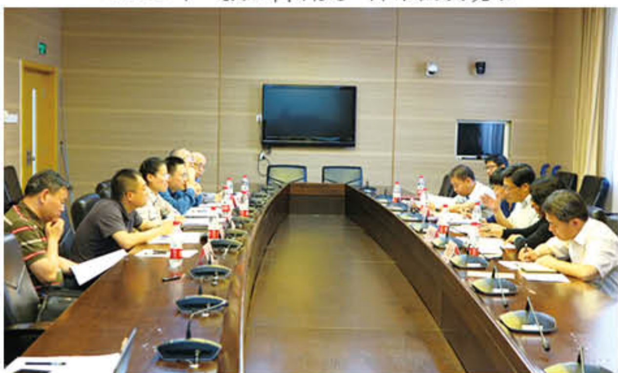
2016年奖助基金评审委员会会议