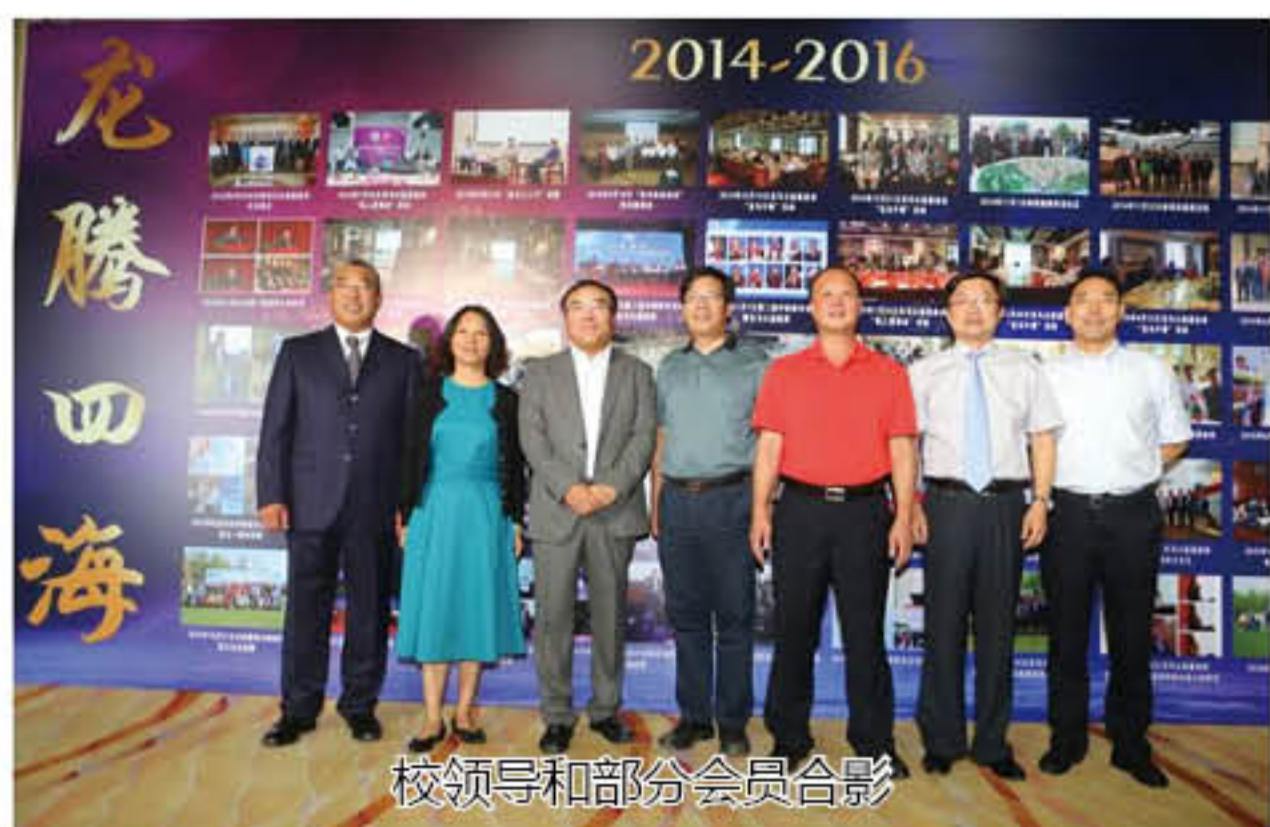
校领导和部分会员合影