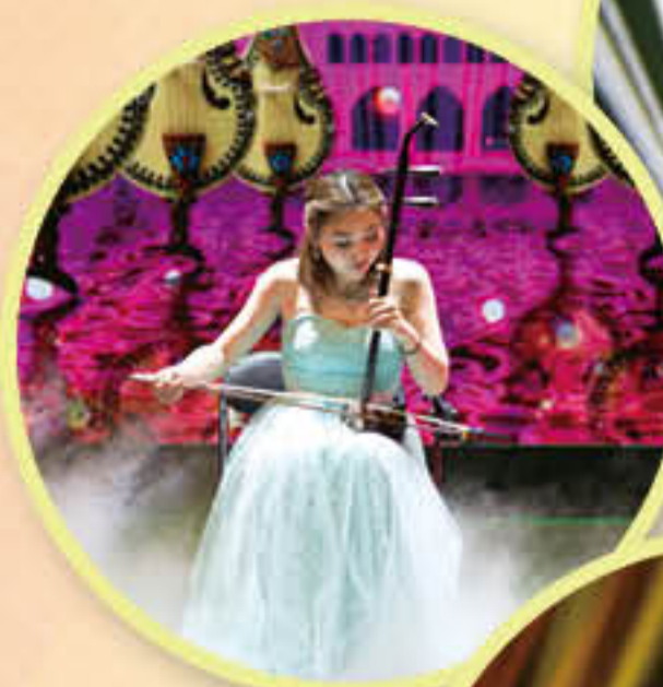
二胡独奏 《葡萄熟了》