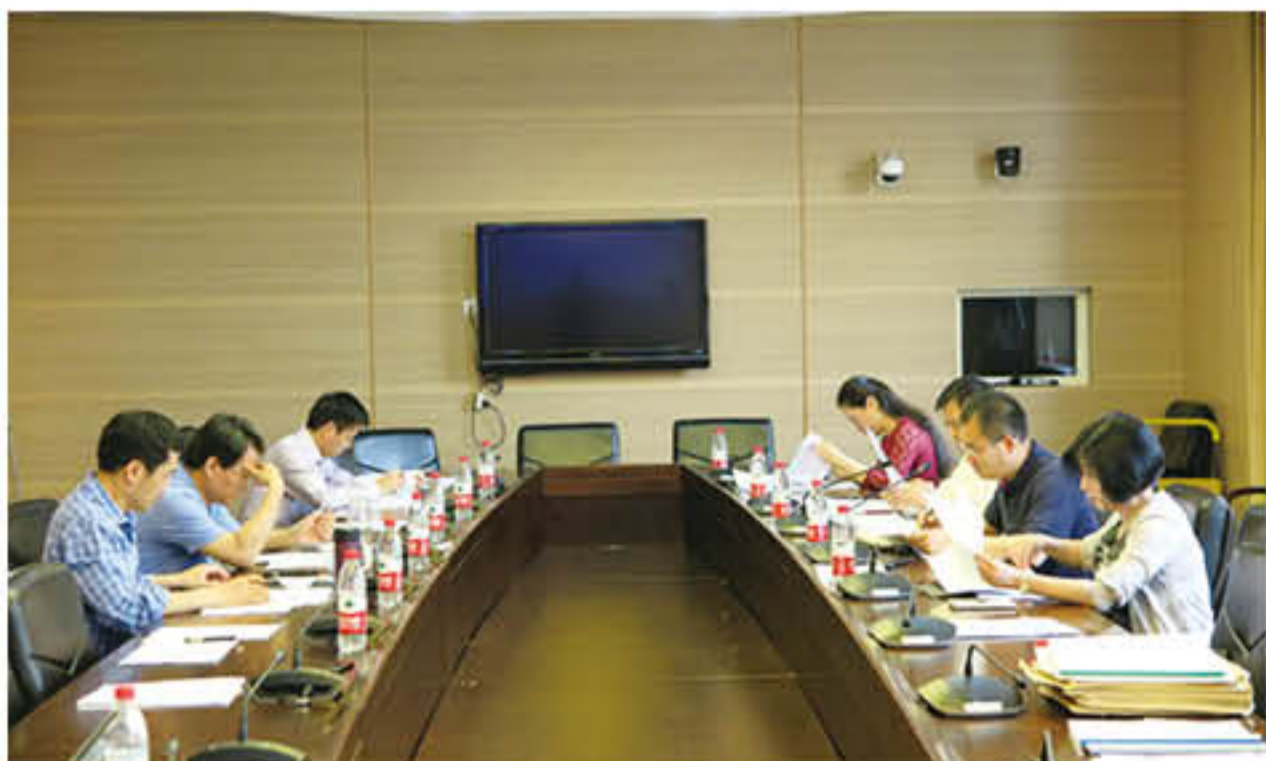
2016年“教学科研奖”评审会议现场