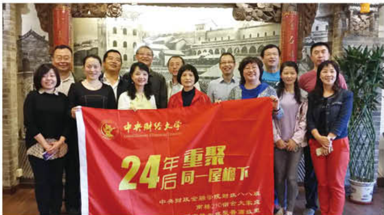
参会校友及家属合影

2016年4月29日-5月2日，经山西校友会提议及精心组织安排，财政88部分校友暨原母校南楼210宿舍（1988—1992年）舍友携家属相约汾河河畔、晋商故里，24年后再次欢聚同一屋檐下。