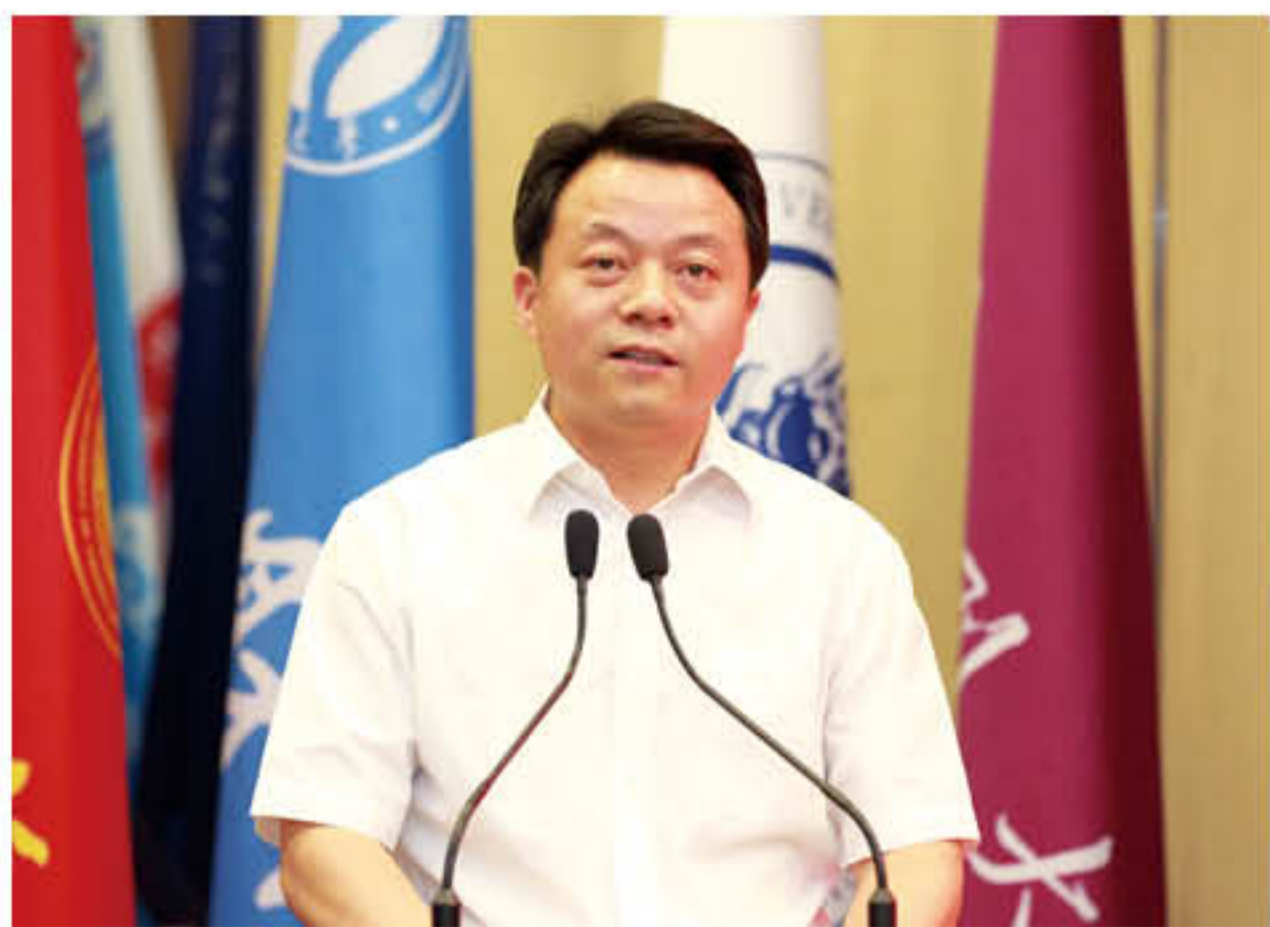
团中央书记处书记傅振邦讲话

为贯彻落实中央群团工作会议精神，推进财经类高校共青团工作的建设与发展，经团中央书记处同意，由我校发起成立全国财经类高校共青团工作联盟。2016年6月1日，全国财经类高校共青团工作联盟成立仪式及相关工作会议在我校举行。团中央书记处书记傅振邦，中央金融团工委书记郭鸿，团中央学校部副部长李骥，中央财经大学党委书记傅绍林，中央财经大学党委常委、校长助理朱凌云，中国工商银行创新管理部处长陈铁钢，来自全国25