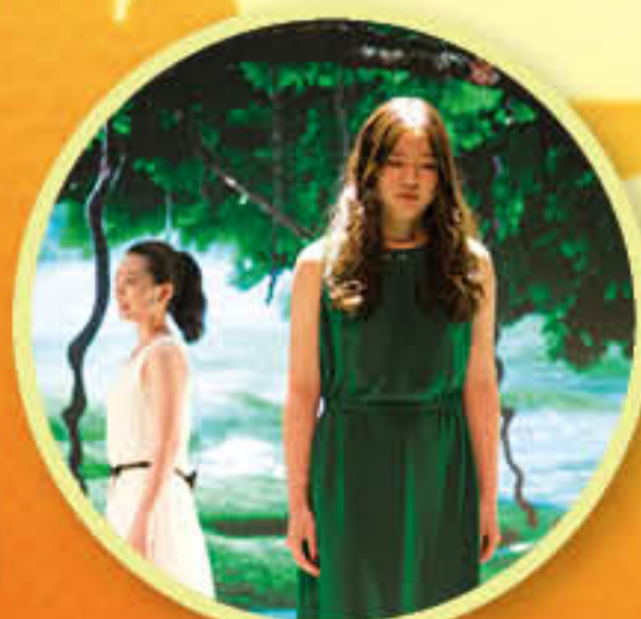
朗诵《那声珍重，你说出口了吗》