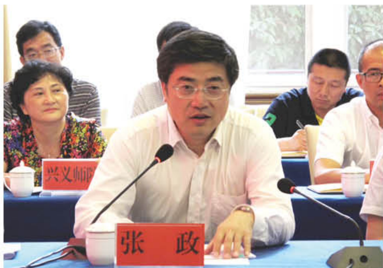
黔西南州委书记张政致辞

黔西南州张政书记首先代表黔西南州对梁勇副书记一行的到来表示热烈欢迎。张书记指出，黔西南是全国重点贫困地区，在“十三五”决战脱贫攻坚、决胜同步小康的