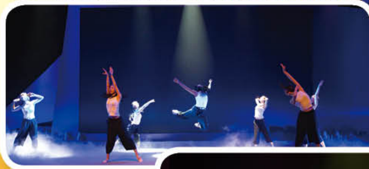
毕业生舞蹈《斑马，斑马》