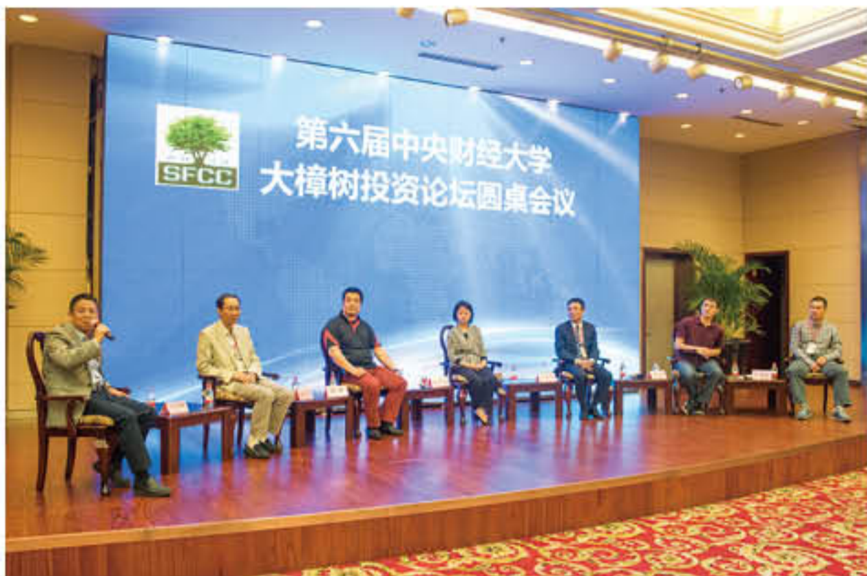
“二级市场论坛” 圆桌会议

会议还举行了中财大樟树投资论坛与杭州市富阳区黄公望金融小镇合作协议签约仪式，未来双方将探索多样化的合作模式，建立紧密、稳定的战略合作关系，共同为富阳的经济社会发展做出积极贡献。