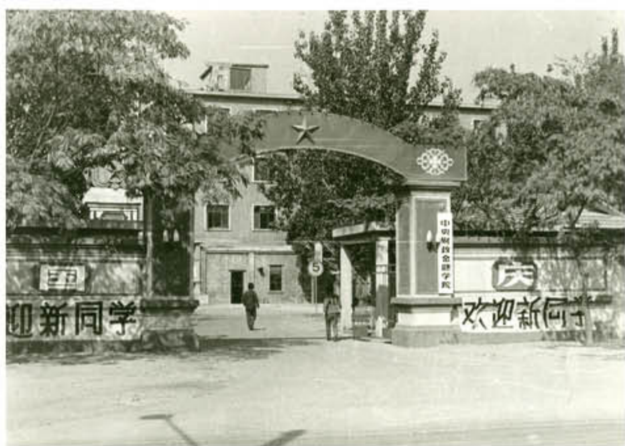
1978年中央财政金融学院复校后校门

视，复校有望了。当时散布于五湖四海的中财旧部，终将野云望为霖，复校工作也由此开始。