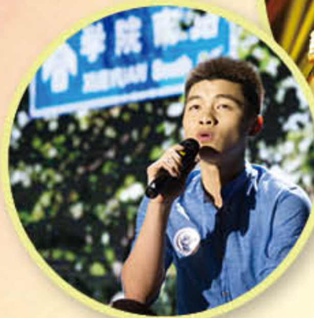
毕业生歌手《中央财经 大学版南山南》