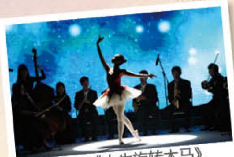
管弦乐《人生旋转木马》