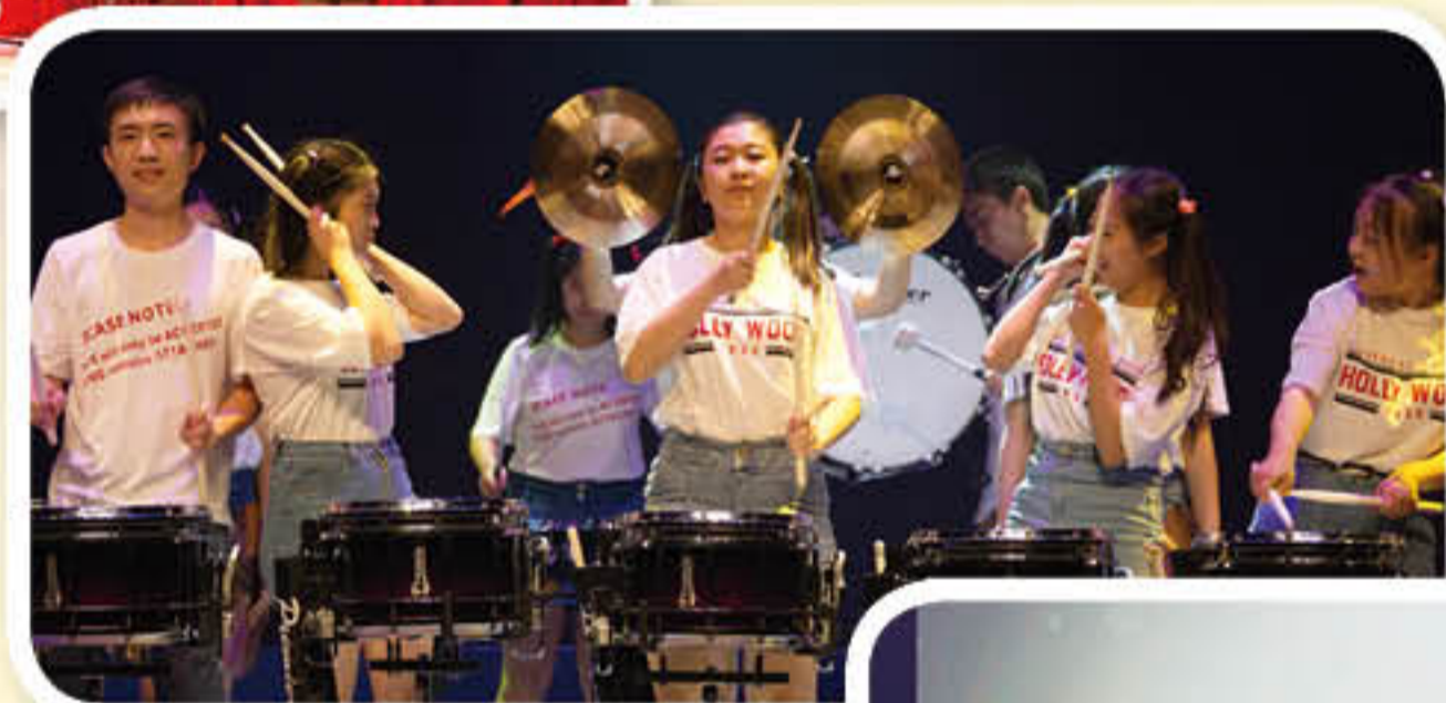
行进打击乐《咚咚咚》