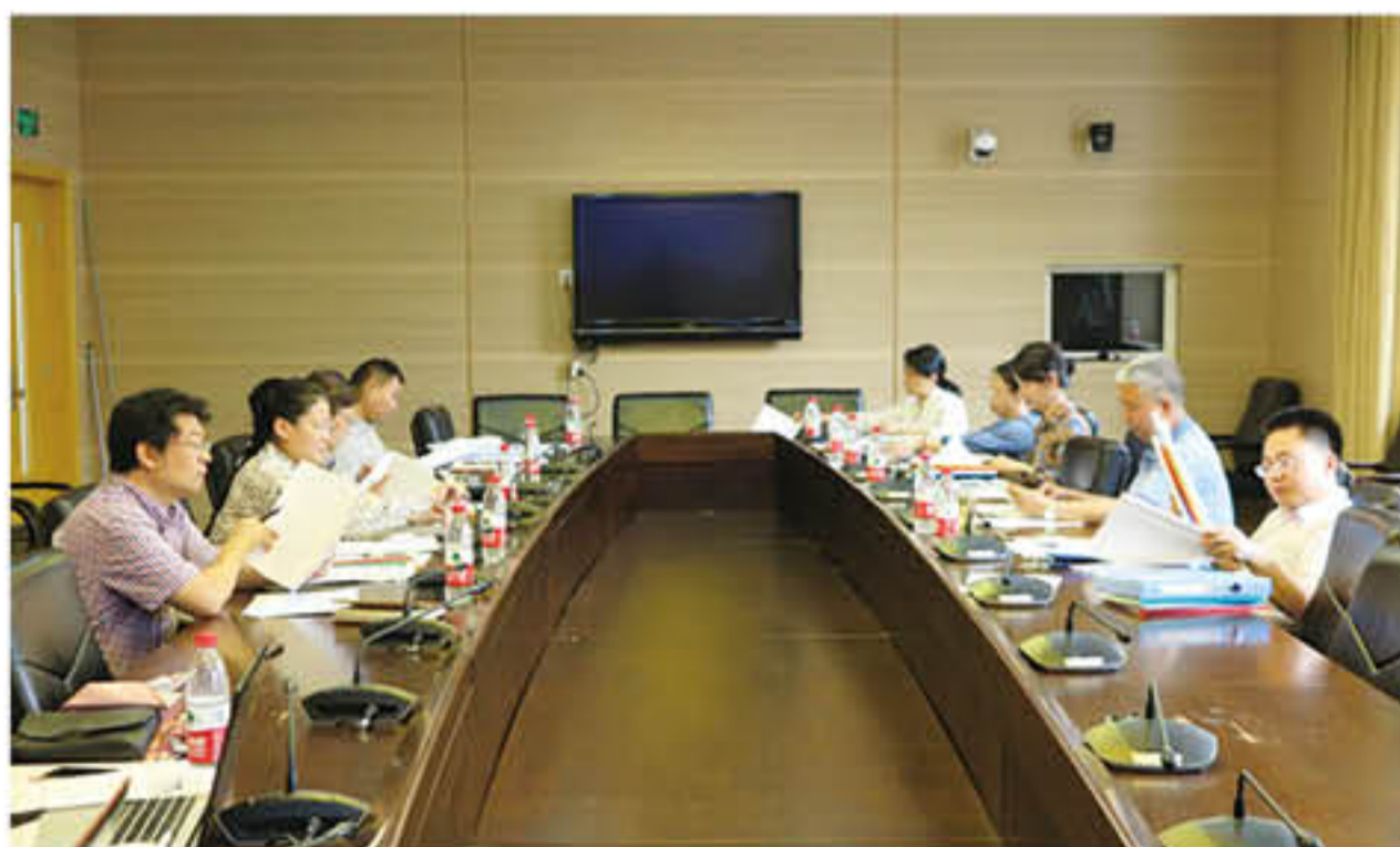
2016 年“党政管理服务奖”评审会议现场

1. 完善申报系统。基金会奖助基金线上申报和审核系统在 2014 及 2015 年成功运行的基础上，进一步完善了申报模块，解决了以往系统遗留的漏洞，保证申报环节的平稳运行。今年新增了恒生银行内地奖学金、华为奖学金等奖项的申报模块，而且以往年度单独申报和评审的建成助学金、红