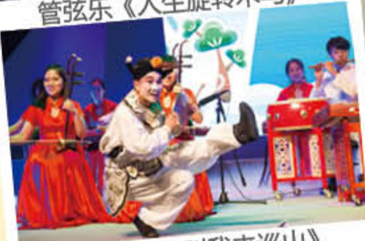
民乐《大王叫我来巡山》