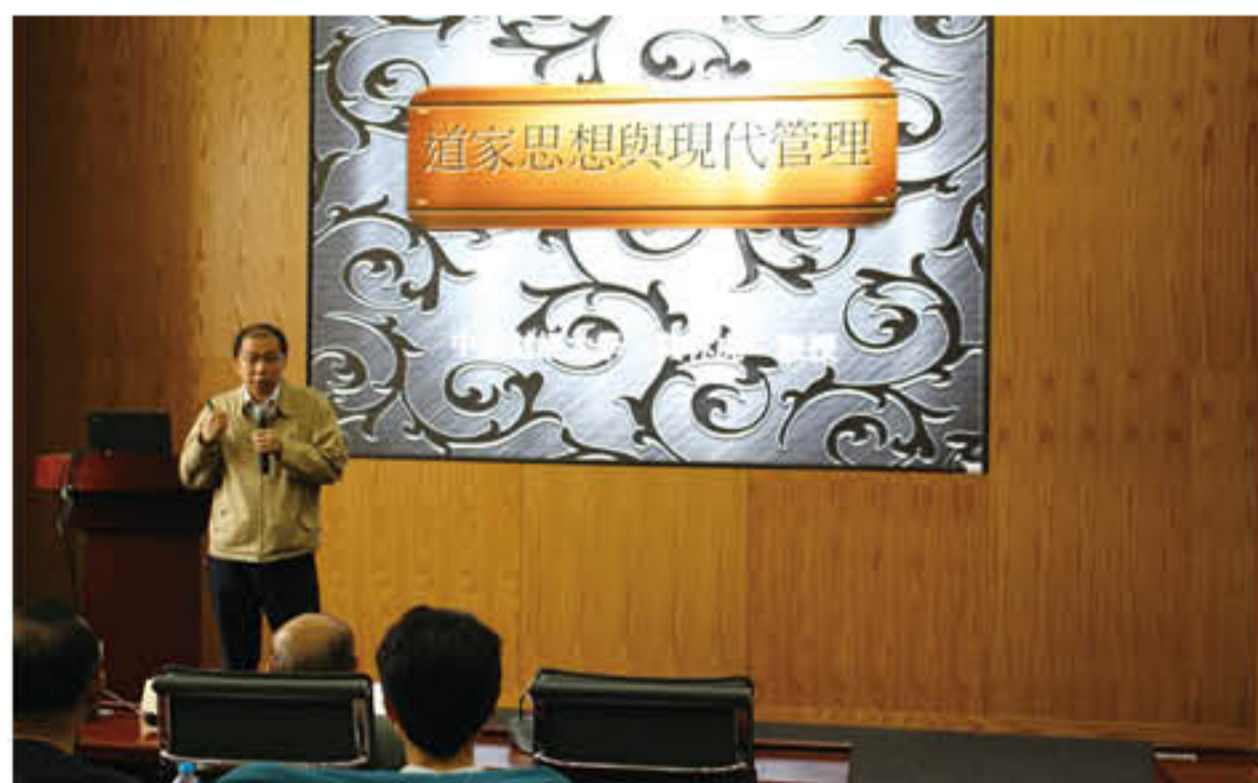
莫老师分享读书心得

本次活动是上海校友会第一次尝试举办读书类的活动，该活动也得到了参与校友们的高度认可。正所谓：生命终有了，修行无止境。读书会让校友们有机会近距离接触大师名家，聆听他们的思想，丰富我们的人生。上海校友会再接再厉，为校友们带来更加丰富多彩的活动，也欢迎校友们的关注和参与！（上海校友会供稿，责任编辑：宁小花）