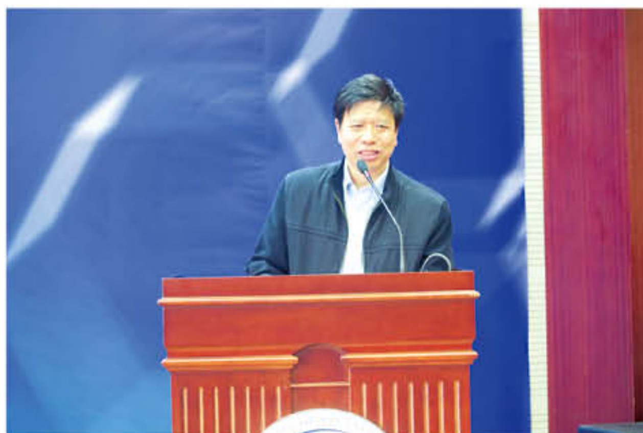
民政部民间组织管理局副局长廖鸿致辞