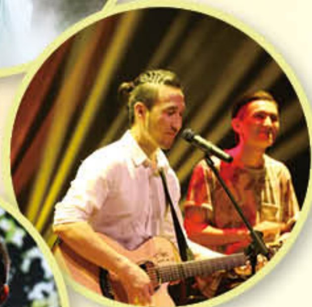
毕业生歌手 《故乡》《回忆》