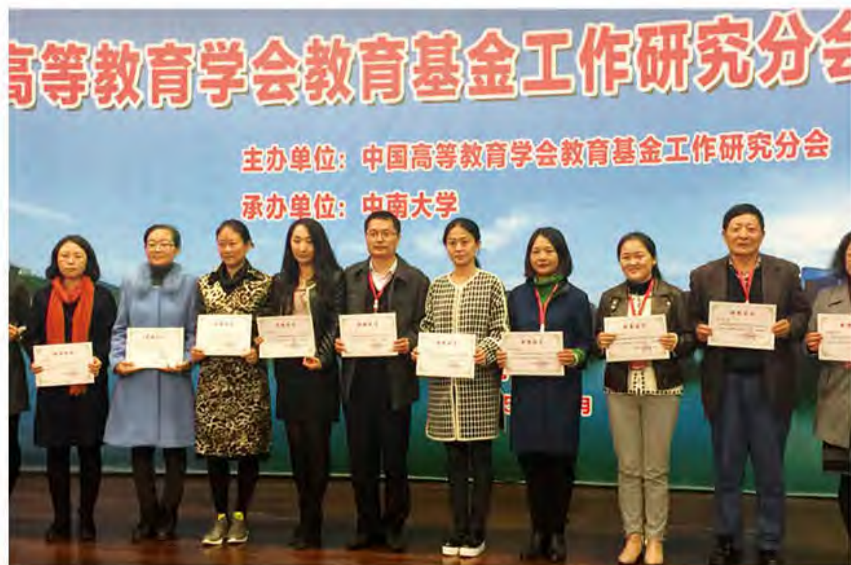
荣获中国高等教育学会教育基金工作研究分会“教育基金先进单位”代表领奖

大国之间的博弈日趋激烈，创建世界一流大学成为一个国家在世界舞台上全面崛起的根本前提，而综合国力的竞争核心之一就是世界一流大学的竞争。校友是高校具有无限挖掘潜力的宝贵资源，在促进一流大学建设、发展和改革中发挥着重要作用。国务院关于《统筹推进世界一流大学和一流学科建设总体方案》进一步表明，通过筹集和整合社会资源支持大学发展目标的实现已经成为各高校的必然选择。从经济、政策、公益生态等多个层面来看，高校基金会都将面临前所未有的发展机遇。