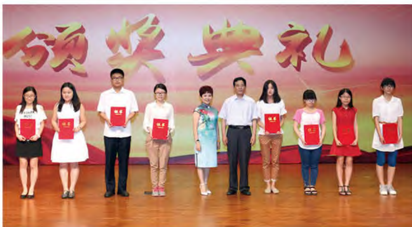
泸州老窖奖励基金颁奖

校奖助基金评审委员会会议，审议并通过了2015年学校各项奖助基金的评审结果。最终，学校上半年共奖助师生1446人，发放奖学、助学、奖教金共376.70万元。其中，奖励资助学生个人918人，奖励学生团队71支，实际发放奖助学金303.20万元；奖励教师141人，发放奖教金73.50万元。另外下半年还有涌金优秀新生奖、成心优秀新生奖、骋望助学金以及部分学院奖助基金的评审工作，预计发放奖助学金145万元。安秘书长表示，基金会将根据捐赠人意愿和学校发展实际，认真做好各项奖助基金管理工作，不断丰富奖励基金体系，完善申报系统，优化评审流程，提高评审效率，用心管好用好捐赠人的每一分钱，让学校师生满意，让捐赠人放心。