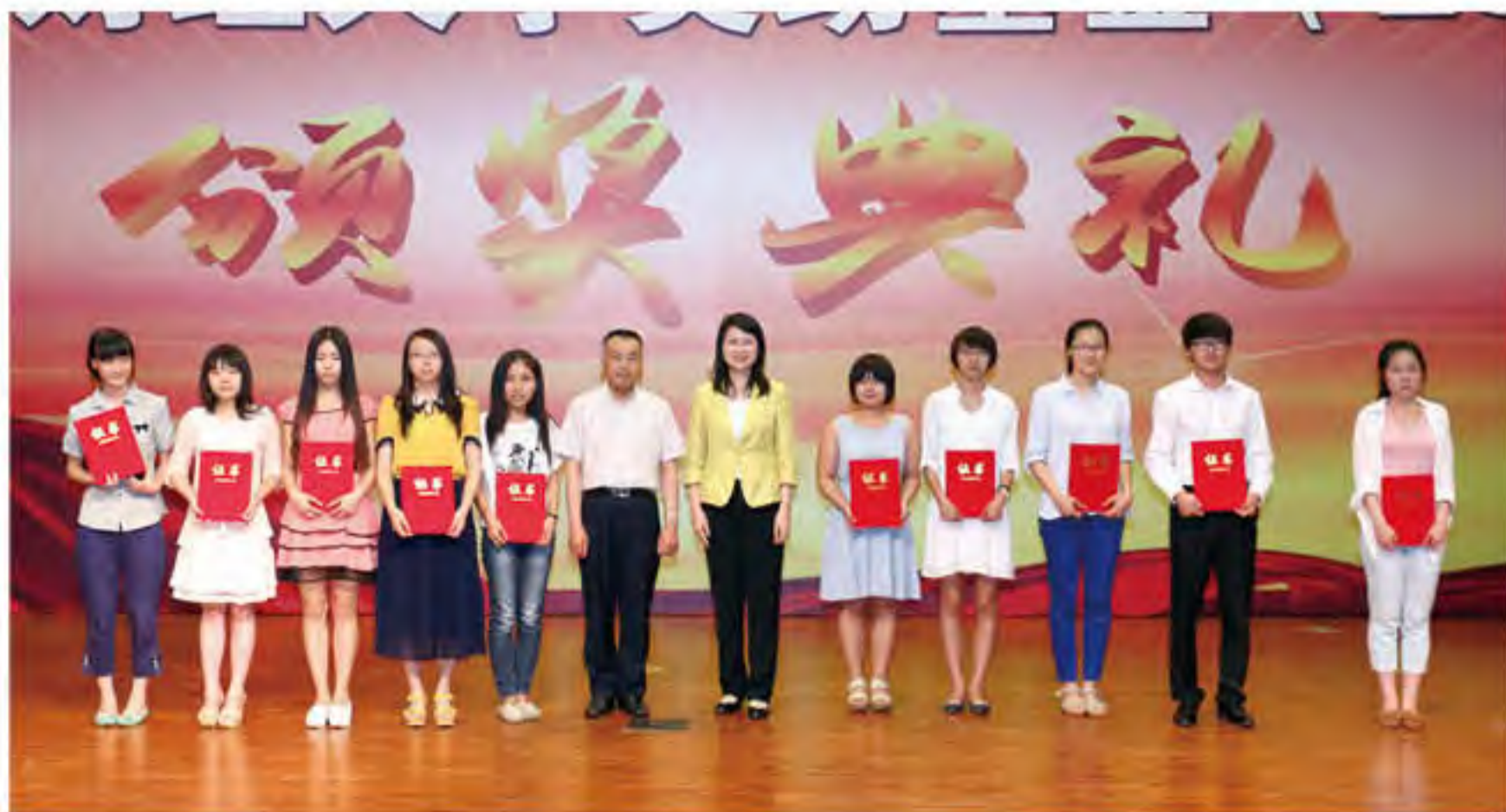
建成助学金、红风助学金、手牵手助学金和校友助学颁奖

由泸州老窖集团2012年在我校设立，重在帮贫济困，鼓励学习进步、热心公益学生的泸州老窖奖励基金，三年来已奖励和资助430名同学，成为了我校影响力很大的公益项目。泸