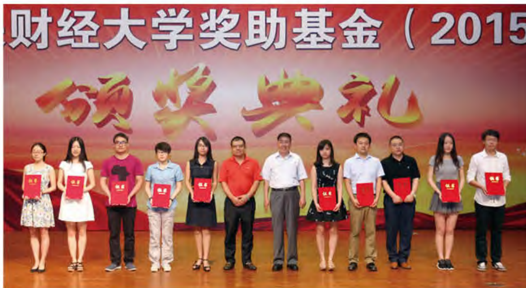
涌金奖励基金颁奖