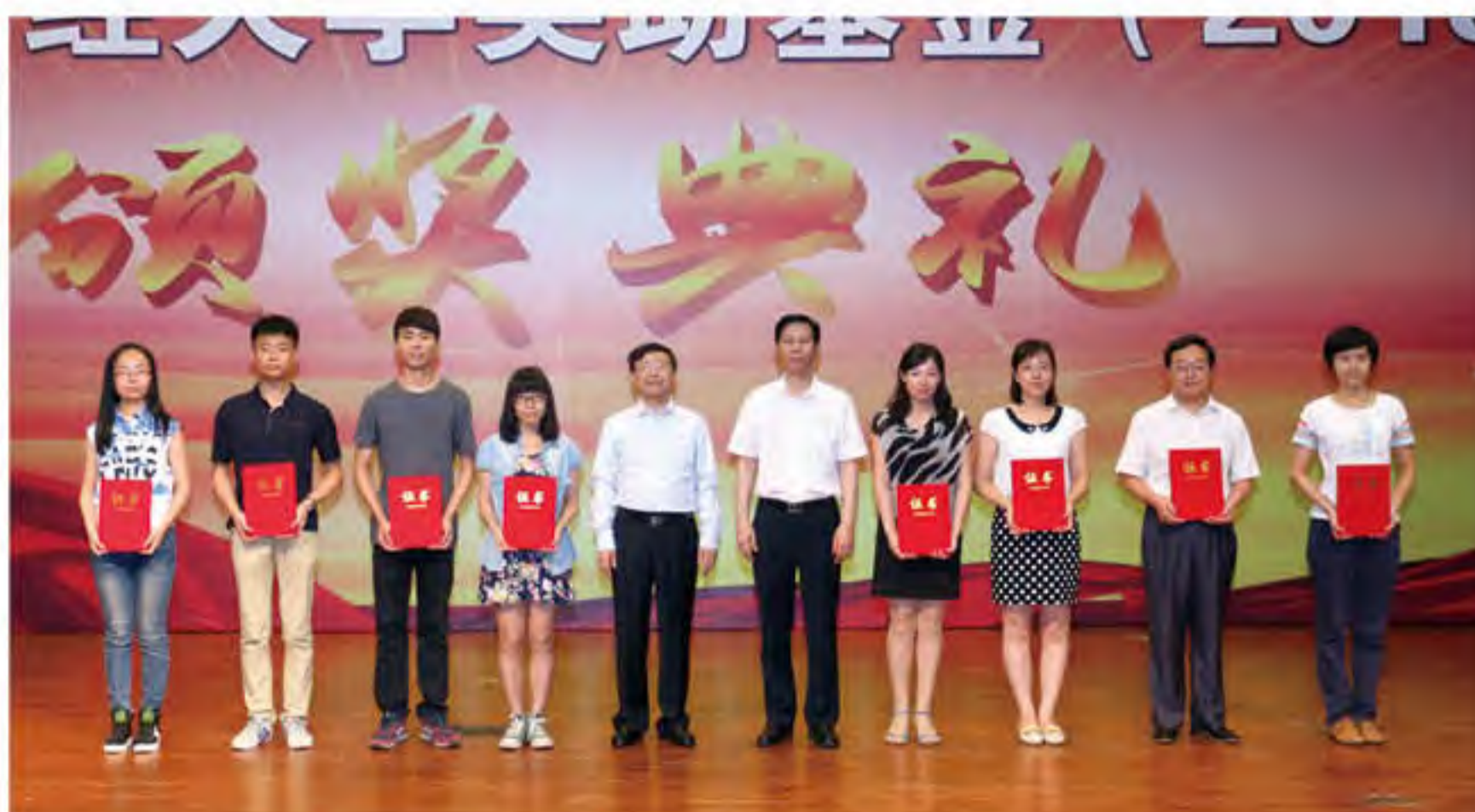
鸿基世业奖励基金颁奖

金各项工作的顺利进行，提高评审效率，确保评审质量，基金会在前期做了充分的准备工作。经过前期充分准备和广泛宣传，2015年基金会共收到全校师生奖助基金申报材料2401份，申报人数占全校师生总数的15%。申报评审期间，基金会秘书处累计接到和答疑师生电话咨询、QQ咨询、微信咨询等数千次。评审期间，全校各学院各部门深度参与，共有来自各单位的156名材料审核员参与了基金线上初审工作。从3月至6月期间，基金会先后组织了建成助学金、红风助学金、手牵手助学金、学生奖助学类、学生综合类、教师教学科研类、教职员工党政管理服务类奖励基金、申玖奖学金、理想创新创业奖、涌金留学奖励和资助项目等十余场奖励基金评审会议，组织召开全