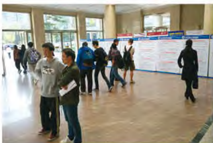
宣传展板吸引众多师生驻足阅读